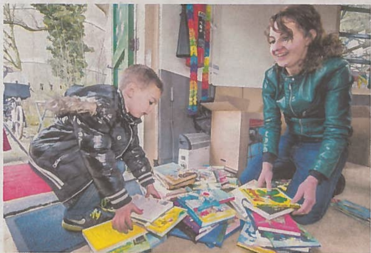
• Zodra er een sticker op zit gaan de boeken zwerven.